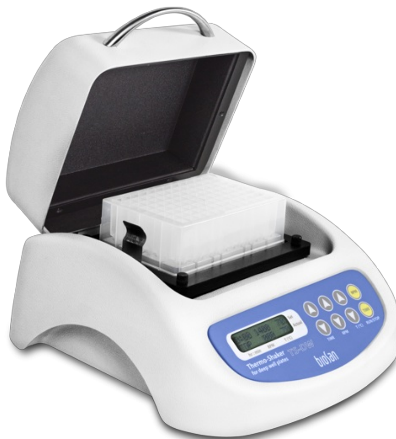
TS-DW Without thermoblock Термошейкер для глубоколоночных планшетов

TS-DW, термо-шейкер предназначен для перемешивания в глубоколоночных планшетах в режиме термостатирования.