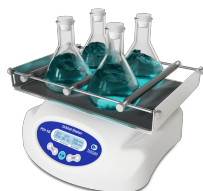
PSU-10i Without platform Орбитальный шейкер

Платформа для чашек Петри, VDLR Latex тестов и планшет.