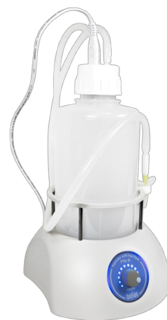
FTA-2i BS-040120-A02 Аспиратор с колбой-ловушкой