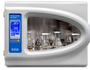
ES-20/80 Software included, without platform Шейкер-инкубатор

Универсальная платформа с зажимами позволяет одновременно разместить колбы или бутылки разного объёма. Зажимы не входят в комплект поставки и их необходимо заказывать отдельно.