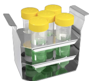
TR-5/30 BS-010406-КК штатив

Штатив для пробирок \varnothing 30 мм, емкость 5 пробирок. ШхГхВ: 155x90x112 мм