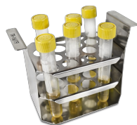
TR-16/19 BS-010406-ФК штатив

Штатив для пробирок \varnothing 30 мм, емкость 5 пробирок. ШхГхВ: 155x90x112 мм