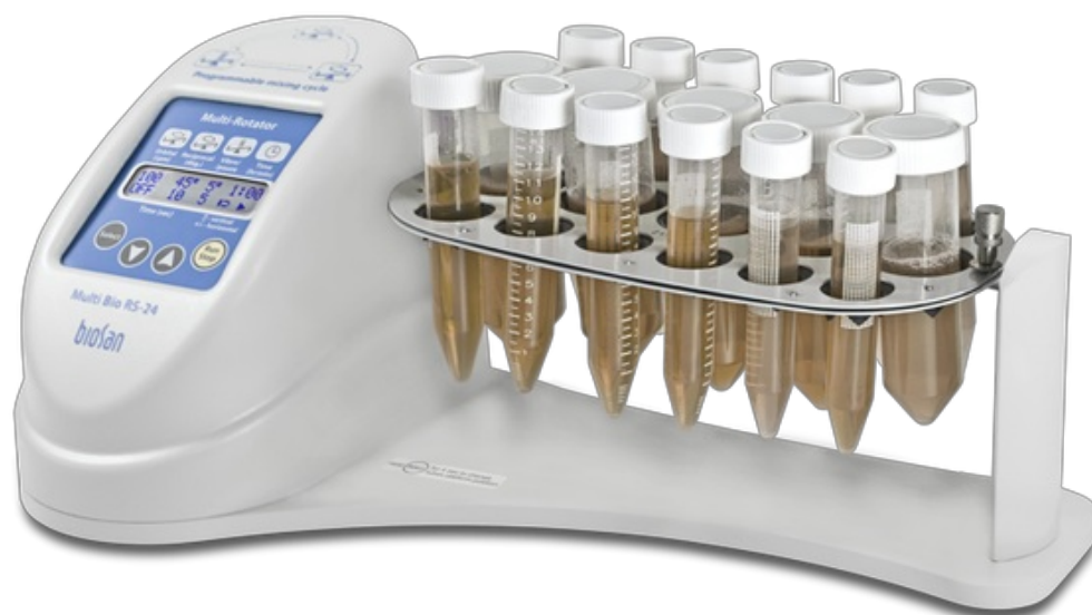
Multi Bio RS-24 Including PRS-26 platform Programmējams rotators

Programmējams rotators Multi Bio RS-24 nodrošina vairāku kustību veidu realizāciju vienā modulī ar mikroprocesora vadības palīdzību ļauj realizēt ne tikai: