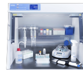
UVT-B-AR With built in socket and inlet for power cords PĶR (PCR) kabinets

UVT-B-AR ir UV gaismas DNS/RNS attīrīšanas kabinets, kas paredzēts, lai radītu tīru, no piesārņojuma brīvu vidi PĶR (PCR) paraugu sagatavošanai un citām ar nukleīnskābēm saistītām darbībām.