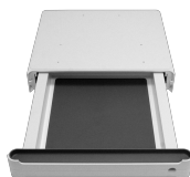
LTD-1 BS-040107-OK Atvilkne

Atvilkne ar neslidošu silikona paklājīnu un klusās aizvēršanas funkciju. Var uzstādīt arī pēc tam.