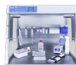
UVC/T-M-AR With built in socket and inlet for power cords PĶR (PCR) kabinets

Kontaktligzdu bloks, izvelkams, ar zilu LED.