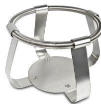
FC-2000 BS-010126-NK turētājs

Turētājs 1000 ml - Ø130 mm priekš UP-168