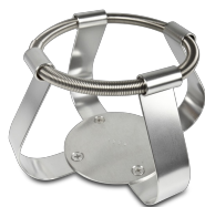
FC-1000 BS-010126-IK turētājs

Turētājs 1000 ml - Ø130 mm priekš UP-168