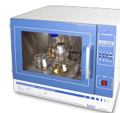
ES-20/60 Without platform Kratītājs-inkubators

Turētājs 1000 ml - Ø130 mm priekš UP-168