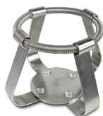
FC-500 BS-010126-LK turētājs