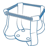
HSC-1000 BS-010167-IK turētājs

Turētājs 1000 ml - Ø130 mm priekš UP-168