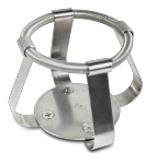
FC-250 BS-010126-JK turētājs