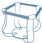
HSC-100 BS-010167-EK turētājs