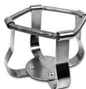
HSC-500 BS-010167-JK turētājs