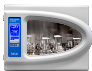
ES-20/80 Software included, without platform Kratītājs-inkubators