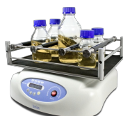
PSU-20i Without platform Multi-funkcionāls orbitālais kratītājs