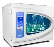
ES-20/80C Software included, without platform Kratītājs-inkubators ar dzesēšanu