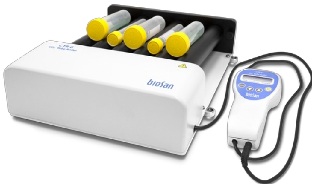
CTR-6 BS-010174-A01 CO 2 Agitatore rotante

Agitatore rotante per provette CO 2 CTR-6 consente di regolare l'oscillazione e il rotolamento di un massimo di 6 rulli ed è progettato per l'uso specifico in incubatrici a CO 2 CTR-6