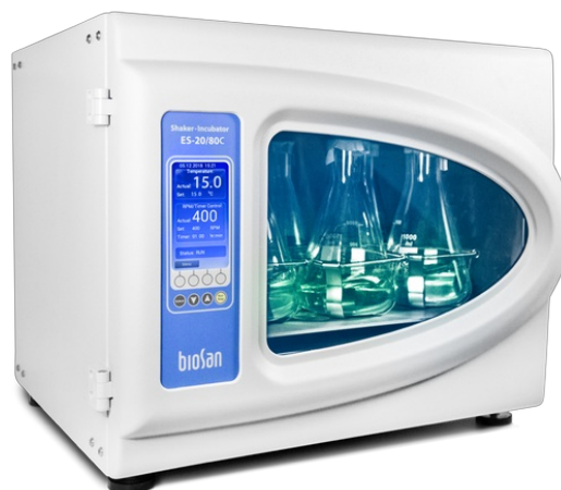
ES-20/80C Software included, without platform Agitatore-incubatore orbitale con funzione di raffreddamento