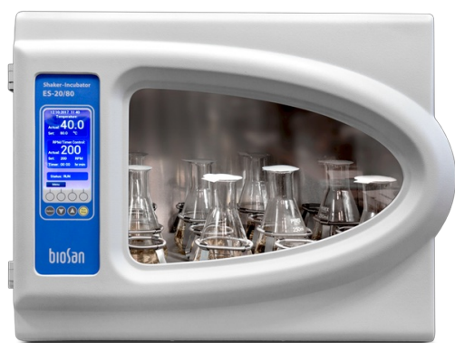
ES-20/80 Software included, without platform Agitatore-incubatore orbitale