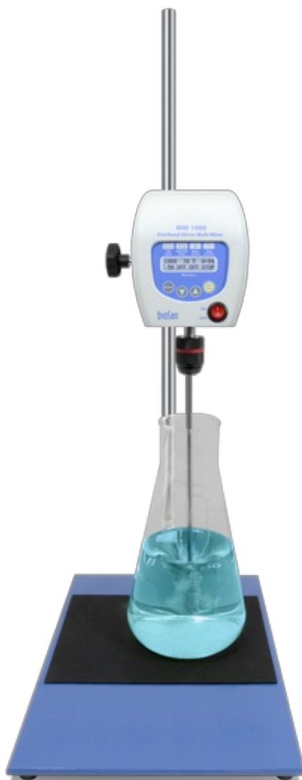
MM-1000 Without stirrer Agitatore sopraelevato multimiscelatore