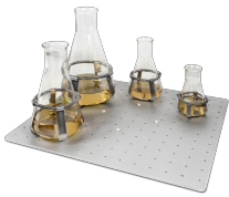
UP-168 BS-010135-JK piattaforma