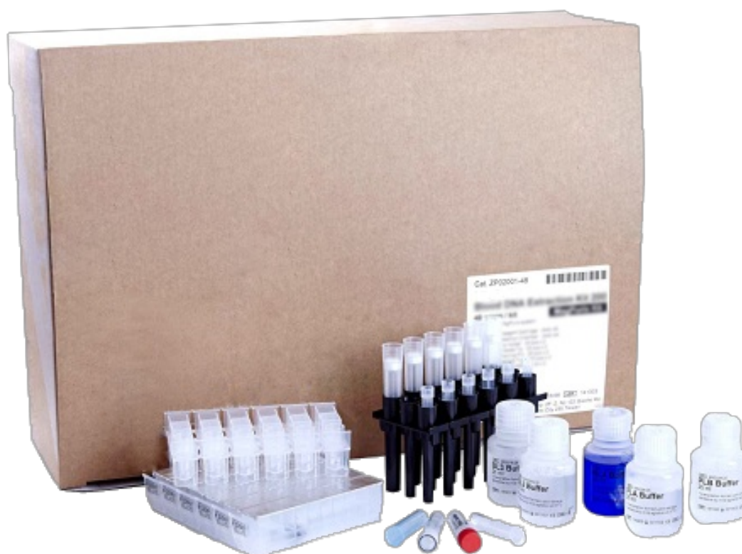
Reagenti per BioMagPure 12 Plus BS-060201-AK