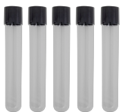
Tubetti di campioni 16mm BS-050102-MK

Tubetti di campioni di vetro 16x100mm, alto borosilicato, tappo in PP con cuscinetto in silicone. Imballaggio: 100 pezzi/scatola