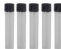
Tubetti di campioni 18mm BS-050102-NK

Tubetti di campioni di vetro 18x100mm, alto borosilicato, tappo in PP con cuscinetto in silicone. Imballaggio: 100 pezzi/scatola