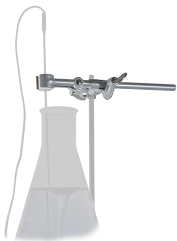
HTP-1 BS-010309-FK supporto

HTP-1, supporto per sonda di temperatura