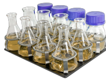
P-12/100 BS-010108-EK piattaforma

Piattaforma piatta con tappetino in silicone anti-scivolo per capsule di Petri, flaconi per coltura, cartine per agglutinazione.