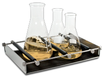
UP-12 BS-010108-AK piattaforma

Piattaforma universale con barre regolabili per diversi tipi di flaconi, bottiglie e becher con tappetino in silicone.