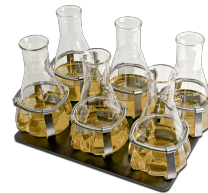
P-6/250 BS-010108-DK piattaforma