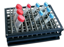
P-16/88 BS-010116-BK piattaforma

Piattaforma con sostegni a molla per un numero massimo di 88 provette di diametro fino a 30 mm (ad es., provette da 10 ml, 15 ml, 50 ml).