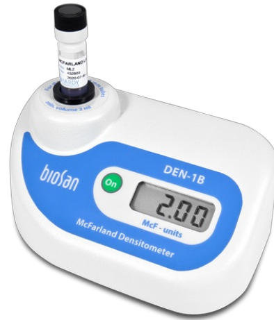
DEN-1B BS-050104-AAF Densitomètre (détecteur de turbidité en suspension)

Les densitomètres sont conçus pour mesurer la turbidité de suspension cellulaire dans la plage unités de McFarland 0,0–6,0 (0 – 180 \times 10^7 cellules/ml).