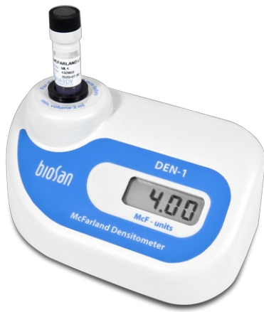
DEN-1 BS-050102-AAF Densitomètre (détecteur de turbidité en suspension)

Les densitomètres sont conçus pour mesurer la turbidité de suspension cellulaire dans la plage unités McFarland 0,0–6,0 (0 – 180 \times 10^7 cellules/ml).