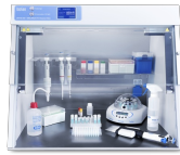
UVT-B-AR With built in socket and inlet for power cords Armoire PCR

UVT-B-AR est une enceinte PCR conçue pour créer un environnement propre et exempt de contamination pour la préparation des PCR et autres processus liés aux acides nucléiques.