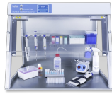
UVC/T-M-AR With built in socket and inlet for power cords Armoire PCR

UVC/T-M-AR est une enceinte PCR conçue pour créer un environnement propre et exempt de contamination pour la préparation des PCR et autres processus liés aux acides nucléiques.