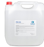
PDS-10L BS-040107-FK Solution de décontamination ADN/ARN 10l