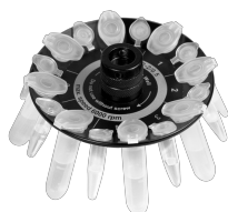
R-2/0.5 BS-010205-CK rotor

Rotor pour 12 tubes de microtest de 1,5/2 ml