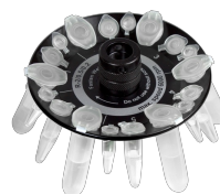
R-2/0.5/0.2 BS-010205-DK rotor

Rotor pour 8 tubes de microtest 2/1,5 ml et 8 tubes de microtest 0,5 ml