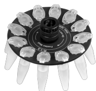
R-1.5 BS-010205-AK rotor

Rotor pour 12 tubes de microtest de 0,5 ml et 12 tubes de microtest 0,2 ml