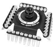
SR-32 BS-010205-FK rotor

Rotor pour 2 lames de microtube de 8 sections de 0,2 ml