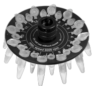
R-0.5/0.2 BS-010205-BK rotor

Rotor pour 12 tubes de microtest de 0,5 ml et 12 tubes de microtest 0,2 ml