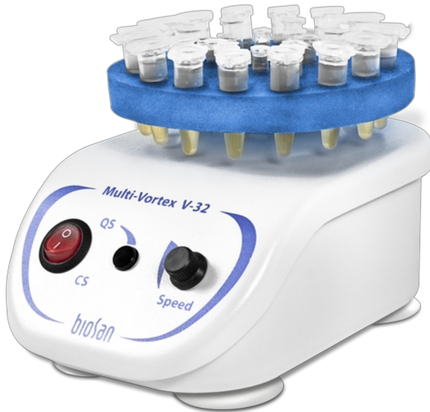
V-32 Including two platforms PV-32, PL-1 Agitador vórtex múltiple para tubos