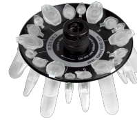
R-2/0.5/0.2 BS-010205-DK rotor

Rotor para 8 tubos de microanálisis de 2/1,5 ml y 8 tubos de microanálisis de 0,5 ml