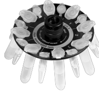
R-2/0.5 BS-010205-CK rotor

Rotor para 12 tubos de microanálisis de 1,5/2 ml