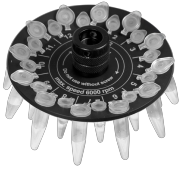
R-05/0.2 BS-010205-BK rotor

Rotor para 12 tubos de microanálisis de 0,5 ml y 12 tubos de microanálisis de 0,2 ml