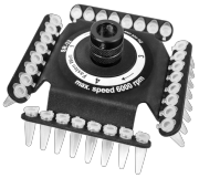
SR-32 BS-010205-FK rotor

Rotor para 2 tiras de microtubos de 0,2ml de 8 secciones