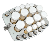
PRS-8/22 BS-010118-AK plataforma

48 tubos 10-16 mm de diámetro (tubos de 1,5 ml-15 ml)