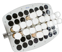
PRS-48 BS-010118-CK plataforma

48 tubos 10-16 mm de diámetro (tubos de 1,5 ml-15 ml)