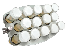
PRS-14 BS-010118-BK plataforma