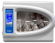
ES-20/80 Software included, without platform Orbitaler Schüttler-Inkubator