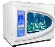
ES-20/80C Software included, without platform Orbitaler Schüttler-Inkubator mit Kühler