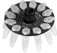
R-1.5 BS-010205-AK rotor

Rotor für 12 x 0,5ml- und 12 x 0,2ml-Mikroteströhrchen